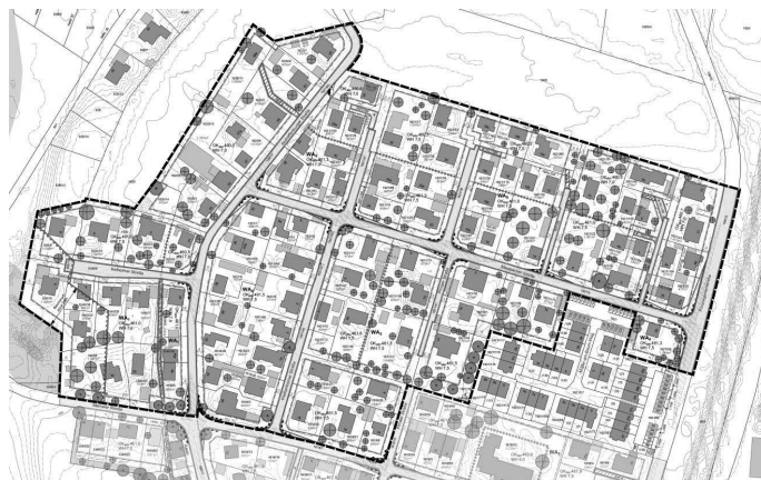
Bebauungsplan Redenfelden - West I Teil III

Insbesondere besteht aufgrund der dynamischen Entwicklung der Bodenpreise ein verstärkter Bedarf an