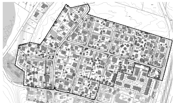
Bebauungsplan „Redenfelden-West Teil III“

Der Gemeinderat hat in seiner Sitzung vom 15.10.2024 die Anregungen zur Aufstellung des Bebauungsplanes „Redenfelden – West I, Teil II + III“ nach der vorgezogenen Bürgerbeteiligung bzw. der Beteiligung der Träger öffentlicher Belange nach § 4 Abs. 1 BauGB behandelt.